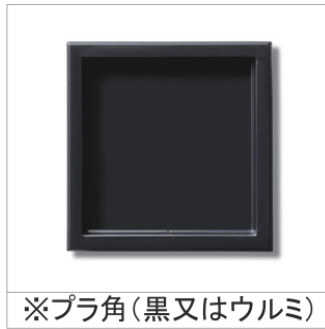
※プラ角(黒又はウルミ)